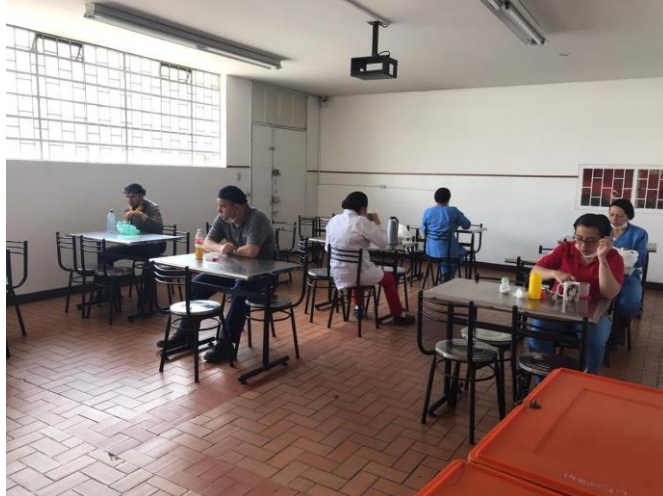
LIMPIEZA CONTINUA DE LOCKER, BAÑOS, COMEDOR