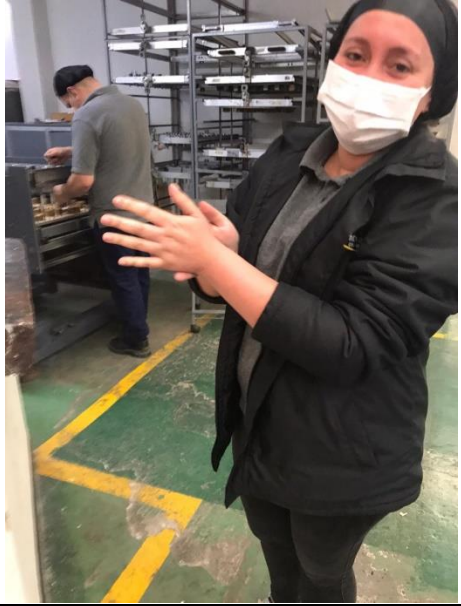
LIMPIEZA CONTINUA DE LOCKER, BAÑOS, COMEDOR